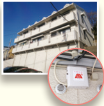
横浜市「イーストマリン」オーナー様 ／1990年築、軽量鉄骨造2階建て、 総戸数13戸(1K～2DK)

導入後に実際にWi-Fiを使ってみて、通信の速さに驚きました。有線で光回線を利用していた時と変わりなく、快適です。Wi-Fi付きは同じ家賃の他物件と比べてかなり有利。そのおかげか、空室がすべて埋まりました。機器の管理やサポートはすべてバッファローさんにお任せで安心。導入して大正解でした。